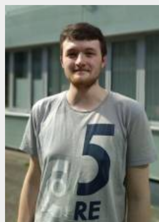
M · S c · P h y s i k ,