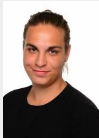
B · E d · M a t h e / E