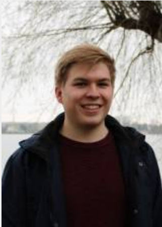
B.Sc. Physik, 7. Semester Hier zu erreichen