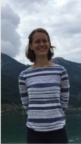
B.Sc. Physik, 1. Semester Hier zu erreichen