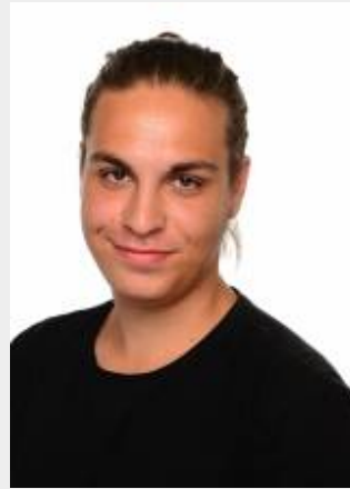
B · E d · M a t h e / E