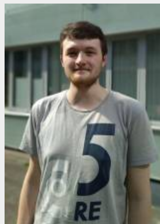
M · S c · P h y s i k ,