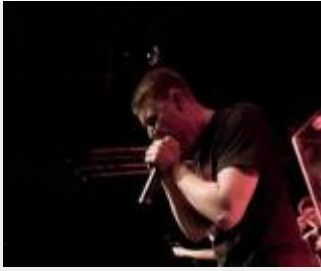
B.Sc. Physik, 1. Semester Hier zu erreichen