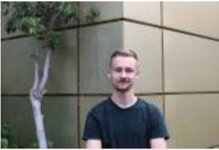
M.Sc. Astrophysics, 2. Semester Hier zu erreichen